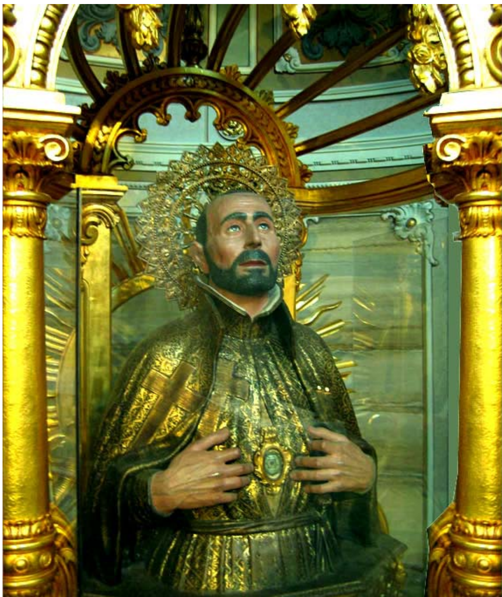
Antica Statua in legno di S. Camillo, detta anche "Taumaturgo", esposta nel Santuario di Bucchianico, qui presente dal 1654