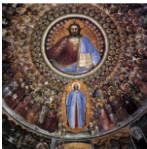
"La candida rosa dei Santi" di Giusto de' Menabuoi , Padova