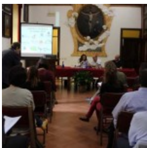
Tavola Rotonda "Fratelli d'ebola" alla Maddalena

Tavola rotonda congiunta su Ebola. Martedì 21 ottobre, in Casa generalizia, abbiamo realizzato un coinvolgente laboratorio di idee attorno all'emergenza generata da Ebola, soprattutto in terra d'Africa (Liberia, Sierra Leone, Guinea Conakri: paesi già colpiti da decenni di guerra civile e da una povertà endemica).