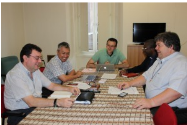
Riunione della Consulta