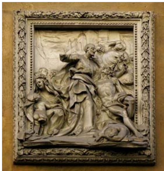
San Camilo, iglesia de Santa Ninfa en Palermo

“La persona, de hecho, en cualquier circunstancia, es un bien para sí misma y para los otros es amada por Dios. Por eso, cuando su vida se vuelve muy frágil y se acerca el fin de la existencia terrena, sentimos la responsabilidad de asistirla y acompañarla de la mejor manera posible”.