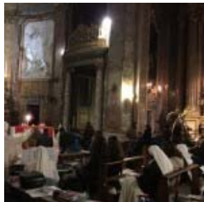
Luces en la noche

Oración y Adoración, el día 07 marzo, por la noche, con los jóvenes, junto con las Hijas de S. Camilo y unos Religiosos Camilos de la Provincia romana, en la iglesia de la Magdalena. ¡Nunca tan participada esta celebración!