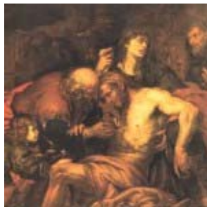
“El buen Samaritano” – olio sobre tela

Los días 11/12 y 17/18 abril, en el Camillianum , se realizará un curso de Pastoral de la Salud: “La gestión de la Fragilidad en la Familia”.