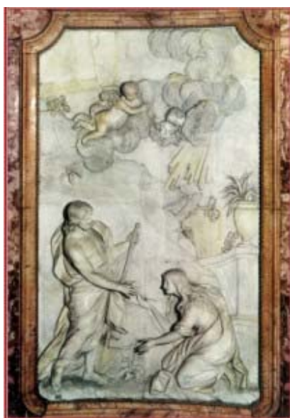
Alto-relieve en nuestra iglesia de la Magdalena: Noli me tangere (Francesco Gesuelli, sec. XVIII)

Este año nuestra tarjeta nace de un alto-relieve colocado en el área del ábside de nuestra bella iglesia de la Magdalena: Noli me tangere (= No me toques )