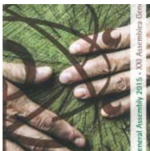
Workshop: Asistencia a los ancianos y cuidados paliativos