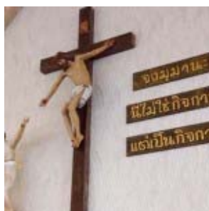
Crucifijo de la nueva cappella del Camillian Social Center de Sampran