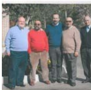
Consejo de la Provincia de España