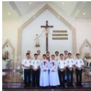
Jóvenes Camilos en Tailandia

En la comunidad de Sampran, luego de la inauguración, el 21 de febrero, de la nueva capilla dedicada a San Camilo, se han celebrado diversos acontecimientos de nuestra vida religiosa camiliana : dos novicios vietnamitas han profesado por primera vez; los profesos temporales – en su mayoría de la Delegación del Vietnam - han renovado su profesión y han estado presentes también 3 otros profesos temporales de Vietnam. A la celebración participaron los representantes de la Provincia de Tailandia, de la Delegación de Vietnam y numerosos feligreses.