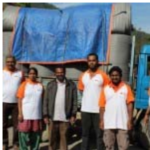
CTF India en Nepal

El 25 abril, un sisma de magnitud muy fuerte ha devastado el área geográfica himalayana en el Nepal determinando destrucción y muerte. La CTF sobretodo integrada por nuestros religiosos de la Viceprovincia de India acompañados por unos colaboradores han movilizado ofreciendo de inmediato su presencia, y apoyo en salud, y psicológico en unos sectores más abandonados.