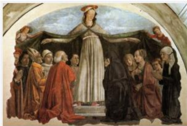
Domenico Ghirlandaio Madonna della Misericordia (1472, Chiesa Ogni Santi – Firenze)

La Vierge est représentée, de face, avec les bras étendue et le corps légèrement incliné, avec une ceinture haut qui donne l'impression qu'elle est enceinte. Des pieds de Marie qui sortent de l'ombre de la robe apparaît une marche où on lit l'inscription « MISERICORDIA DOMINI PLENA EST TERRA » (« La terre est pleine de la miséricorde du Seigneur »).