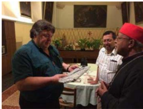
Mons. Berhaneyesus Demerew Souraphiel, cardenal de Addis Abeba- Etiopìa