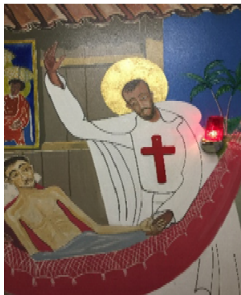
Murales – Capilla de la comunidad camiliana en Macapà - Brasil

Nunca debe afectar el “pongan más corazón en esas manos” .