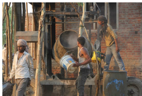
Costruzione in corso delle case. I beneficiari contribuiscono con il lavoro