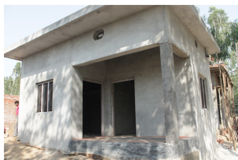
Le nuove case che saranno presto assegnate