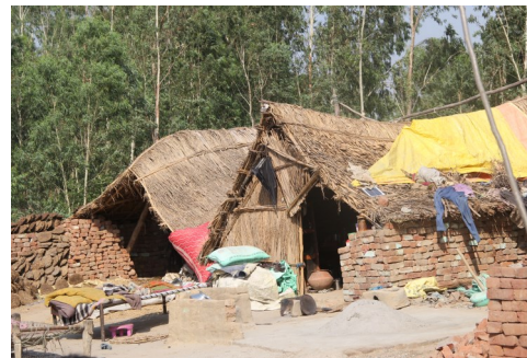
Persone accolte in rifugi temporanei nel giugno 2013