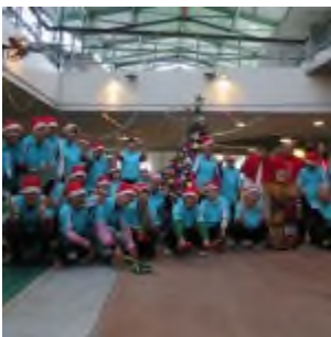
Cerimonia di accensione dell'albero di Natale

Ogni anno all'inizio dell'Avvento si svolge la cerimonia di accensione dell'albero di Natale , un momento di preghiera per ricordare a tutti che Gesù è venuto a portare la vera luce che illumina ogni creatura.