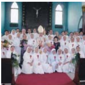
Iglesia de S. Camilo en Lotung

La iglesia de S. Camilo en Lotung, ha sido escogida entre las 5 iglesias de la Diócesis de Taipei, como santuario para recibir las indulgencias durante el Año Santo de la Misericordia. En el próximo mes de febrero 2016, los 5 sacerdotes responsables de estas parroquias irán a Roma para recibir una especial bendición del Papa.