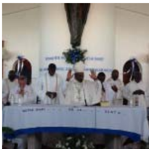
Camilos en Haití