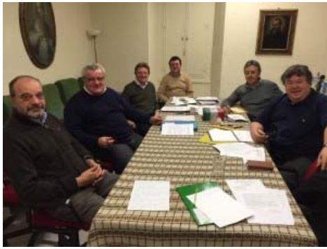
Comisión Económica Central