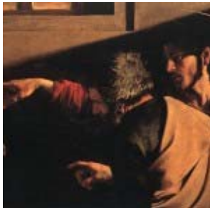
Particular del cuadro "Vocación de San Mateo" del Caravaggio

de los ojos del cuerpo, cuanto con los ojos de la bondad interior. Vio un publicano y, ya que lo miró con amor misericordioso en vista de su elección, le dijo: 'Sígueme'.