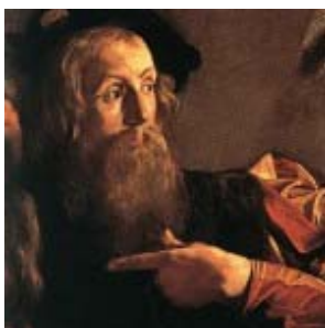
Particular del cuadro "Vocación de San Mateo" del Caravaggio

Por eso asumir en la insignia el lama " Miserando atque eligendo " significa ponerse al lugar de Mateo, mirado por Jesús con misericordia y llamado a estar con Él, a pesar de sus pecados.