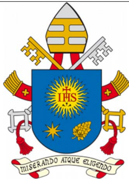
Insignia de Papa Francisco