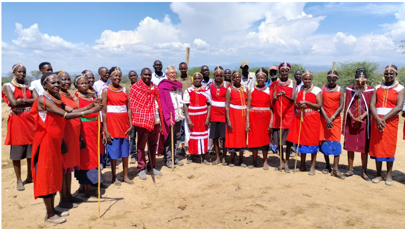
Visite de suivi CADIS au Kenya, 2023

ressources et à absorber les déchets produits. Il s'agit de la "dette" qu'un pays développé ou industrialisé doit aux pays moins développés en raison de son utilisation excessive des ressources et de sa contribution à la dégradation de l'environnement. Elle reconnaît que certaines nations ont historiquement bénéficié de l'exploitation des ressources et de la pollution de l'environnement, avec des conséquences négatives pour d'autres nations et les générations futures. Il souligne l'obligation éthique des nations industrialisées de reconnaître et de corriger ces déséquilibres en soutenant le développement durable, la protection de l'environnement et la politique de suffisance écologique.