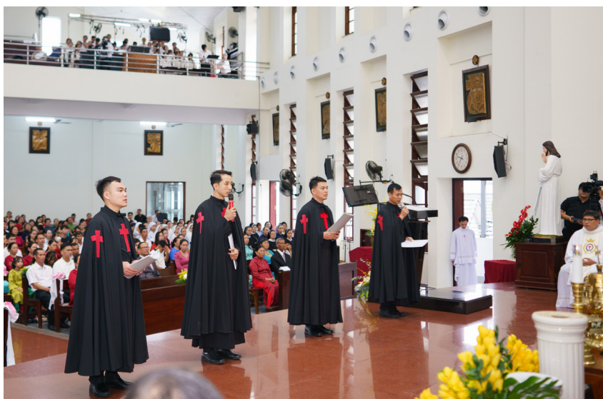
Professione solenne celebrata in Vietnam