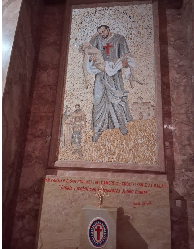
La mosaïque représentant Saint Camille, dans le sanctuaire de San Giovanni Rotondo