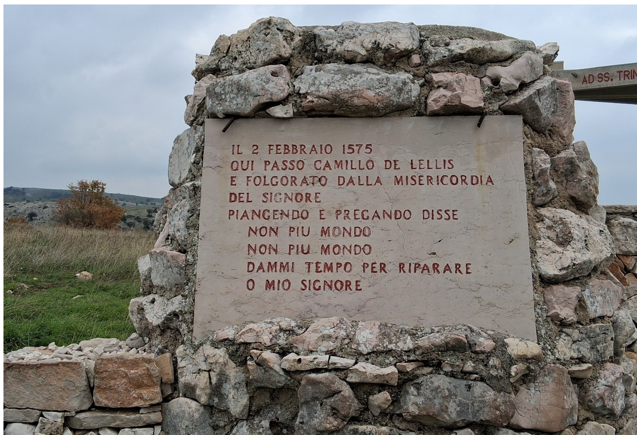
Le lieu de la conversion de Saint Camille, Valle dell'Inferno

Arrivés à Bucchianico, village natal de saint Camille, nous nous rendons à l'endroit où il est né le 25 mai 1550 : l'étable de la maison paternelle. Nous nous retrouvons ensuite devant le sanctuaire de Saint Camille pour prier ensemble,