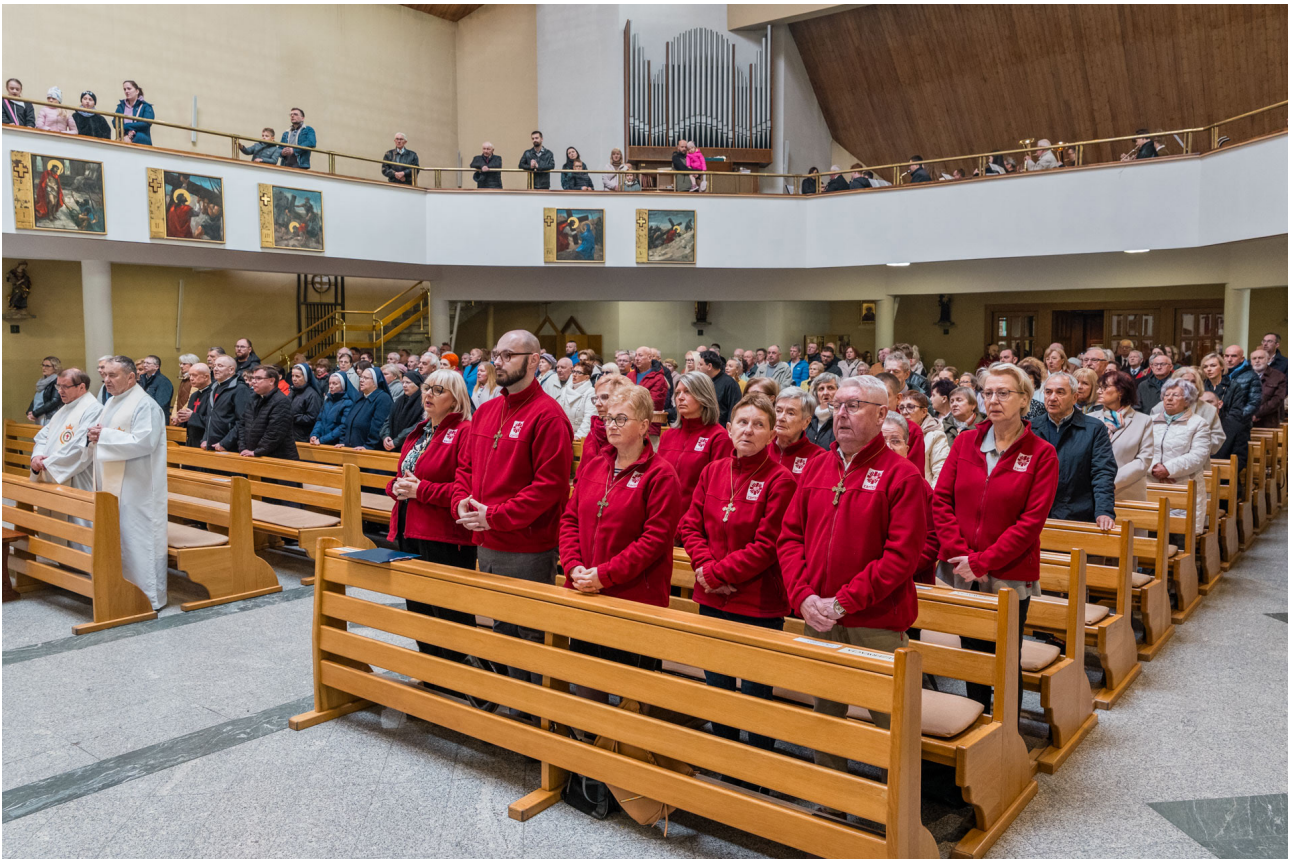
Momento della S. Messa per le celebrazioni degli 80 anni

Infatti, grazie all'azione di un papa polacco che il 30 aprile 2000, ha istituito la Domenica della Misericordia, la misericordia è diventato un bene di tutta la Chiesa.