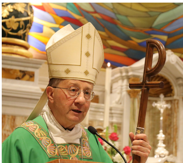
Mons. Bruno Forte, arcivescovo di Chieti-Vasto

Sull'esempio di San Camillo, continuiamo a testimoniare la misericordia di Cristo nel servizio ai malati e alle persone più fragili. Il Signore, per intercessione della Madre del Signore, salute degli infermi, e del nostro fondatore, san Camillo de Lellis, benedica il nostro Ordine e ci sostenga nel servizio ai malati e ai poveri.